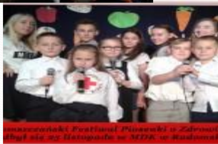
Wskazywanie Festiwalu Piosenki i Zdrowia zbył się w listopadzie w MDA w Rudniku